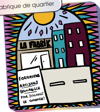
La Fabrique de quartier

Un pôle alimentaire qui coopère avec les commerçant.es locaux et les nouveaux lieux de formation (Tiers-Lieux) pour appuyer la création d'activités « nourricières » utiles au quartier.