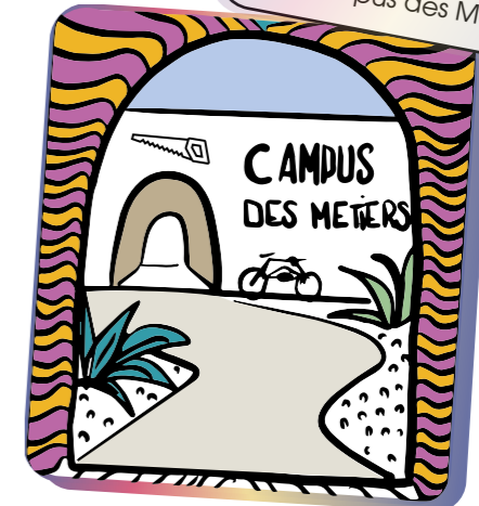
Le Campus des Métiers

Un lieu de renouvellement des pratiques d'apprentissages , tourné vers l'artisanat et les "nouveaux métiers de la transition".